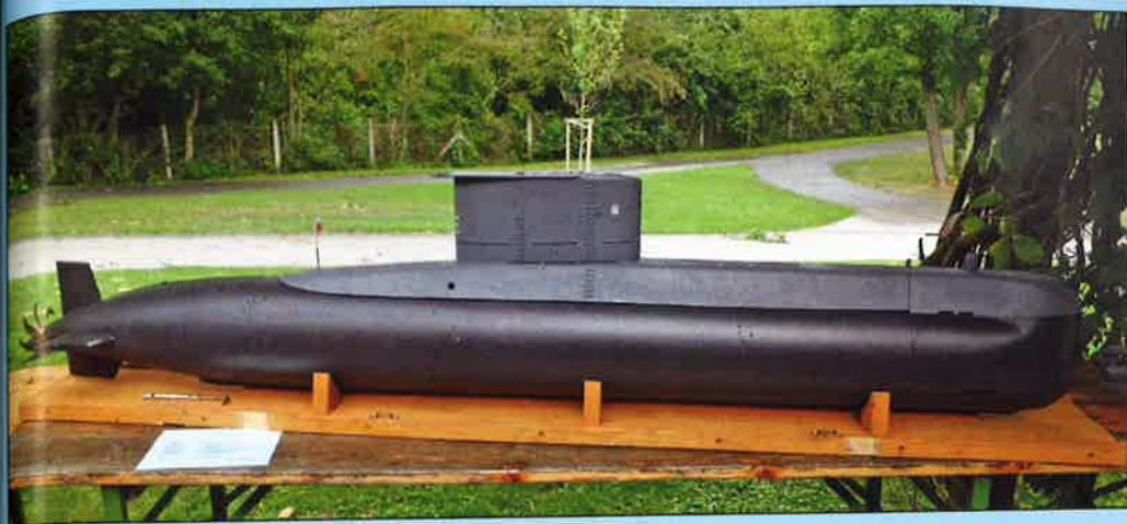
Rozestavěný model chilské ponorky Simpson třídy 209/1300L z roku 1984 manželů Beutnerových z Německa