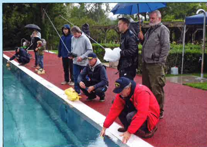
Nedělní dopoledne se bohužel neobešlo bez deště